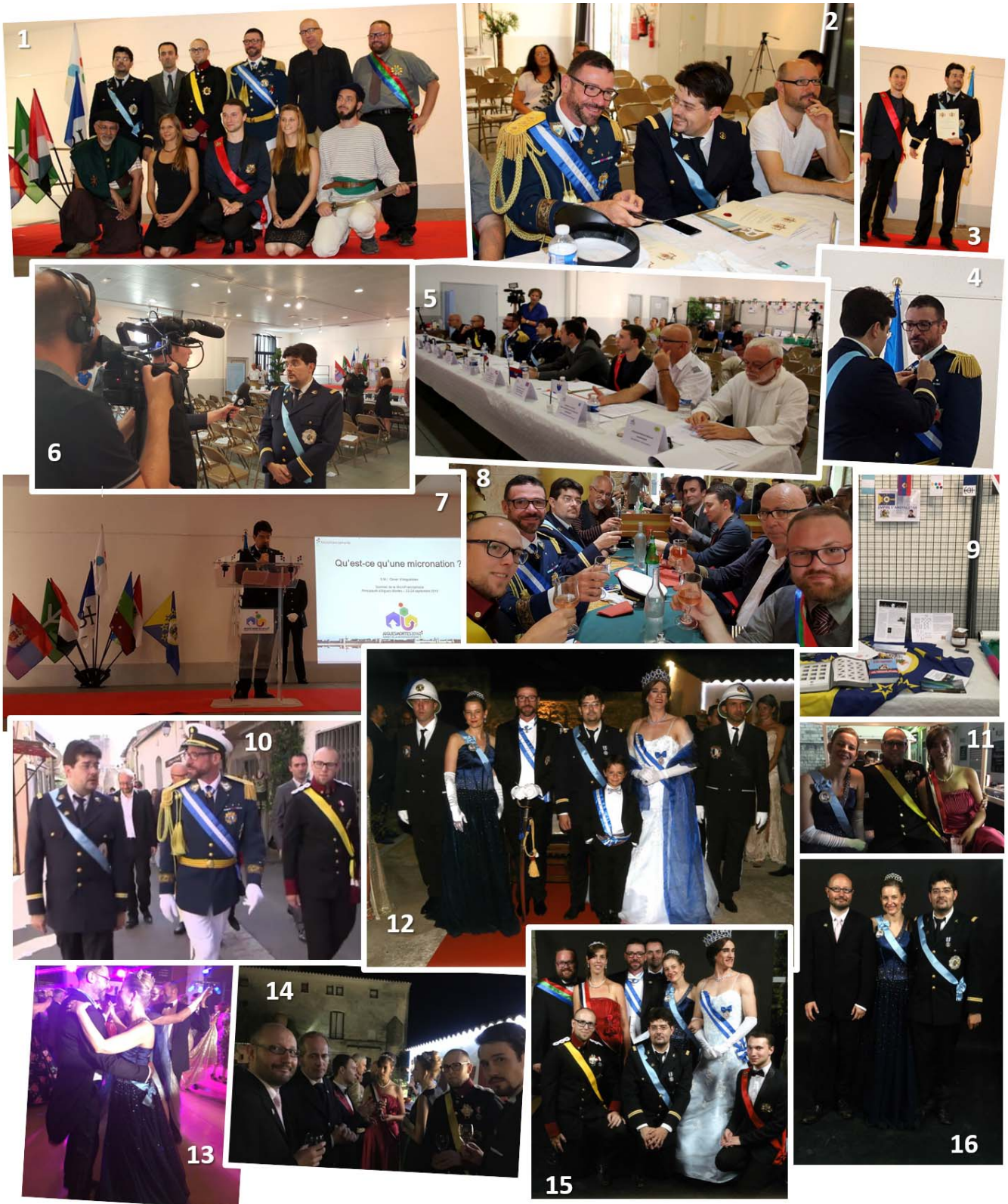
1. Parmi les participants, SMI Olivier d'Angyalistan, SE Geoffrey, comte de Sealand, SAR Niels de Flandrensis, SAS Jean-Pierre IV d'Aigues-Mortes, SM Kaloni le navigateur, vice-Roi de la Mer, SE Dominic Desaintes, président de la République de Saint-Castin, le TH Fomoiré Sogoln Yg Ysca, SE Irina Anedel, ambassadrice d'Aigues-Mortes en Autriche, SAS Vincent d'Hélianthis, SAR Gretchen de Ladonia, l'Honorable Tagathun Raugul Yg Veadans. 2. Pendant la pause, joyeuse complicité avec SAS Jean-Pierre IV aux côtés de SE Frédéric, margrave de Plainpalais, ministre de l'air comprimé et des fonctions affines. 3. SMI distinguée par le Prince d'Hélianthis. 4. Remise de l'ordre du Sextant d'Or à SAS Jean-Pierre IV. 5. Des participants attentifs. 6. Interview pour la chaîne C8. 7. Intervention de SMI Olivier : « Qu'est-ce qu'une micronation ? ». 8. Moment de détente dans un restaurant d'Aigues-Mortes. 9. Espace d'exposition de l'Empire. 10. En promenade dans les rues d'Aigues-Mortes. 11. L'Impératrice Clotilde en route pour le Grand Bal du Godet d'Or avec le couple grand-ducal de Flandrensis. 12. Arrivée au bal du couple impérial, accueilli par LL.AA.SS. Jean-Pierre IV et Olivia-Eugénie et le petit prince Jean-Rosé sous l'œil de la garde princière. 13. SAS Jean-Pierre IV a accordé l'une des premières danses à SMI Clotilde. 14. Les invités trinquent à la MicroFrancophonie. 15. SE Dominic Desaintes, SAR Delphine de Flandrensis, SAS Jean-Pierre IV d'Aigues-Mortes, SE Geoffrey, comte de Sealand, SMI Clotilde d'Angyalistan, SAS Olivia-Eugénie d'Aigues-Mortes, SAR Niels de Flandrensis, SMI Olivier d'Angyalistan, SAS Vincent d'Hélianthis. 16. La délégation angyalistanaise prend la pose pour la photo officielle.